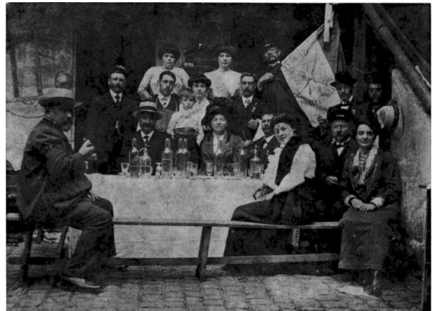
La Compagnie de Montfermeil en 1910

Les douze membres de la Compagnie tirent une « partie de deuil » à la mémoire du Chevalier Georges Douet, mort au champ d'honneur.