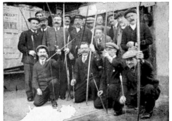
La Compagnie de Montfermeil en 1924